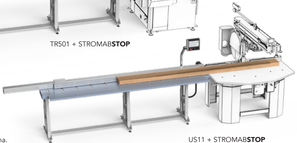
US11 + STROMABSTOP

In abbinamento a macchine con tagli semplici o combinati (rotazione e/o inclinazione) non sono gestite le geometrie lama.