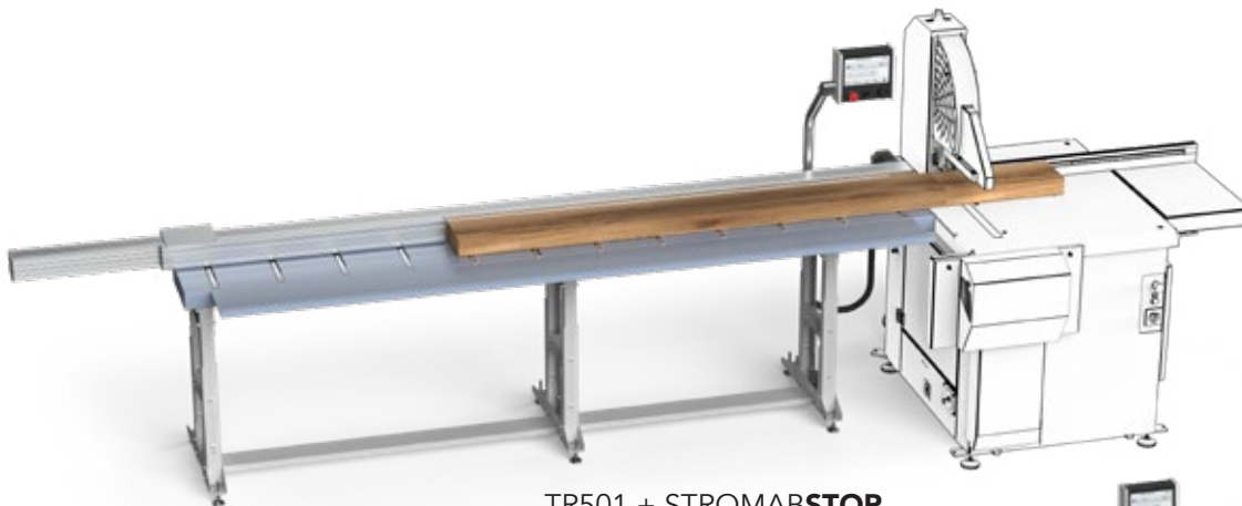
TR501 + STROMABSTOP